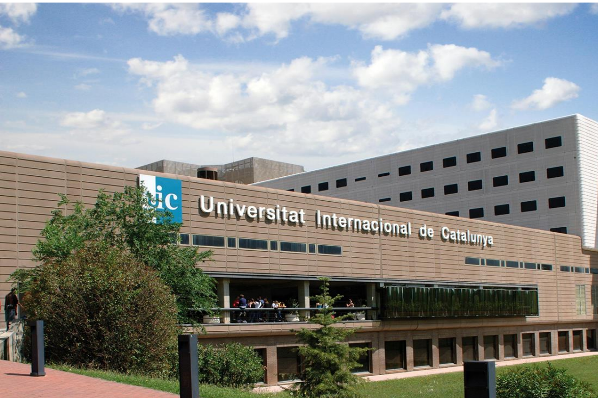
Campus St. Cugat del Vallès (Barcelona)